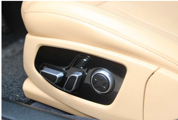
图 1-1. 座椅位置与舒适性开关设备

德州仪器 (TI) 在通用汽车 MCU 领域的最新投资成果是 MSPM33C321A-Q1 器件。MSPM33C321A-Q1 器件旨在满足汽车市场的最新需求。MSPM33C321A-Q1 器件提供了更强的计算和模拟性能，具备汽车级安全防护特性以应对最新要求，同时保持获得 AEC-Q100 认证的器件当前具有竞争力的成本结构。