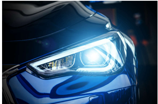
图 1-2. 前照灯与转向信号模块