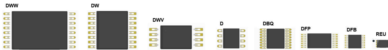
図 3-2. パッケージ オプション

TI のデジタル アインレータでは、さまざまな用途に対応するさまざまなパッケージ オプションが用意されています。REU などの小型パッケージは、絶縁要件が低く、スペースに制約のある設計に適しています。また、DWW などの大型オプションは、より要求の厳しいアプリケーションにおいてより高い絶縁定格と沿面距離を提供します。