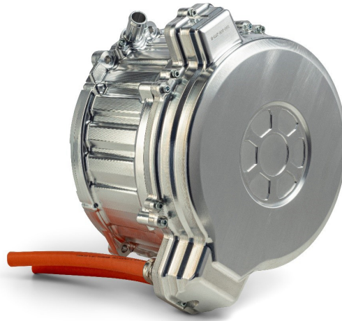
그림 2. EM250x75 500kW eModule 및 통합 EMPEL Lightning 인버터

차세대 트랙션 인버터는 모터 토크 및 전기적 특성에 대한 더 높은 제어를 통해 더 높은 성능을 구현하거나, 부분적으로 더 깊은 수준의 시스템 모니터링 및 진단을 지원하기 위해 더 많은 제어, 더 높은 성능, 더 정교한 감지 기능이 필요합니다. 뛰어난 성능을 넘어, 그림 1 에 표시된 것과 같은 인버터는 중요한 서브시스템이 문제에 직면할 경우에도 토크를 제공할 수 있어야 합니다.